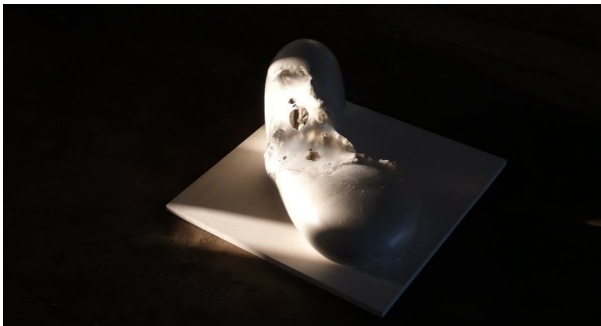
Organisme, 2011 (ubrændt ler og plastik)