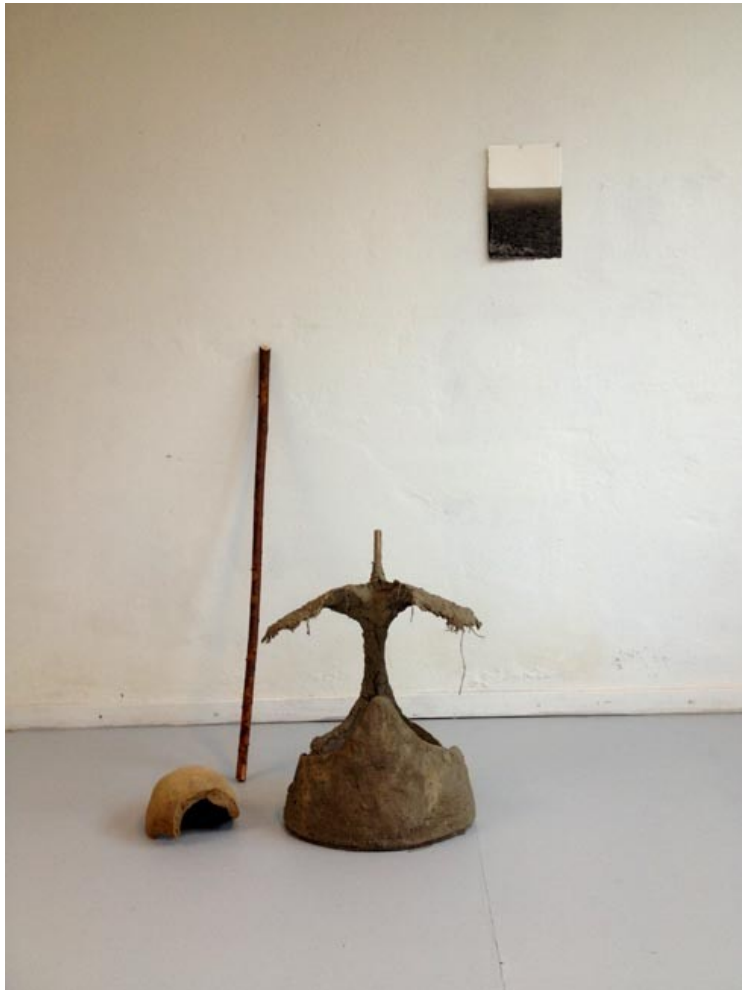
Rustning, 2012 (ler, træ, ler på papir)