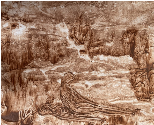
Eva og Adam, 2024 (ler på papir)

Jeg har ofte spurgt mig selv, hvorfor netop leret blev mit foretrukne materiale. Svaret forekommer næsten selvindlysende: Leret er en symbolsk reference til mennesket og jorden. Skabelsesmyterne fortæller, at mennesket formes af ler og får indblæst liv.