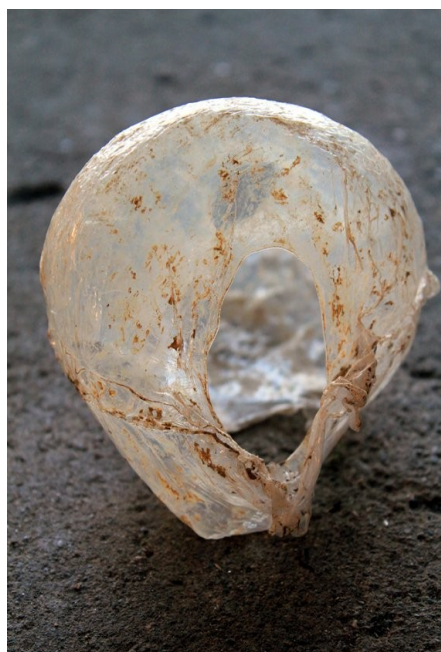
Membran, 2011 ( ler og plastik)