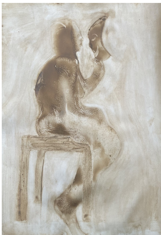
Siddende kvinde der holder en maske, 2026 ( ler på papir)

Dette essay er et forsøg på at undersøge denne nødvendighed.