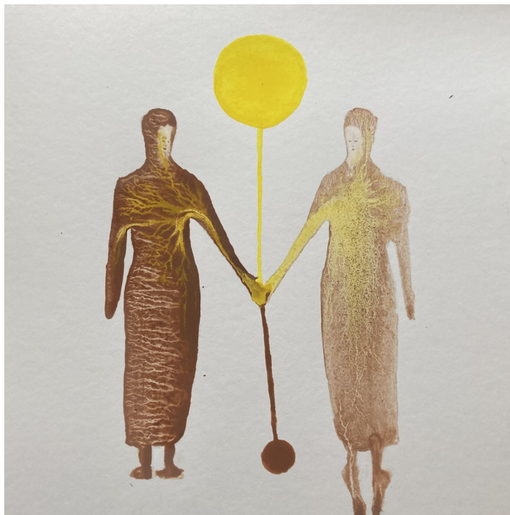
Safe, 2025 (ler, akvarel på papir)

I den forstand er kunsten ikke en luksus. Den er en praksis i det at høre hjemme i verden.