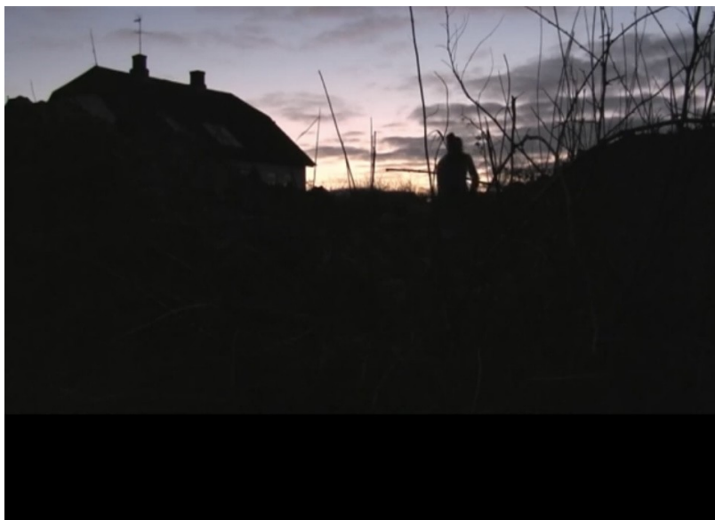
Anchorage, 2012 (video, still-billede)