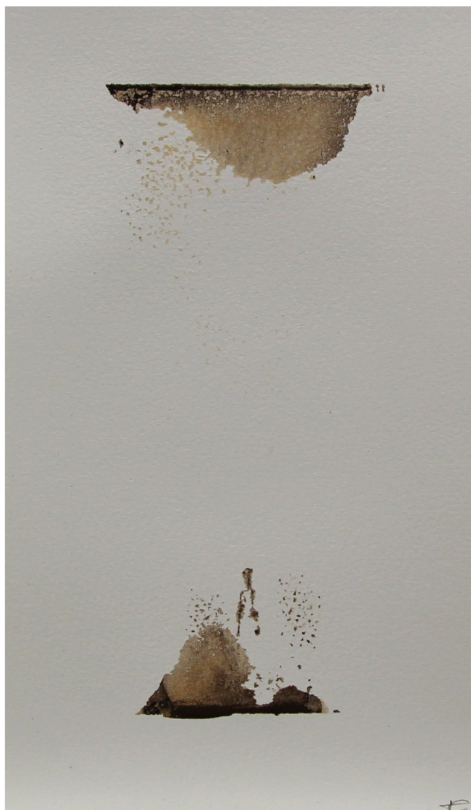
Uden titel, 2014, (ler på papir)

At være menneske er at være indlejret i en verden, man ikke konstant betvivler. Der findes en præ-refleksiv tillid – en kropslig forankring – som gør, at vi kan handle uden at skulle etablere os selv forfra i hvert øjeblik. Denne tavse struktur er fundamentet for al erfaring.